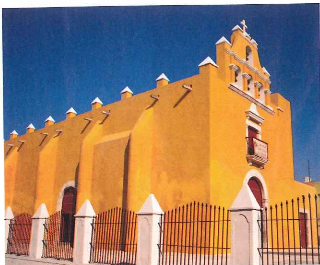
Des maisons seigneuriales aux églises, la pierre de Campeche revêt de multiples couleurs.

Ne vous fiez pas à ses couleurs tendres, Campeche a longtemps été un repaire de pirates.